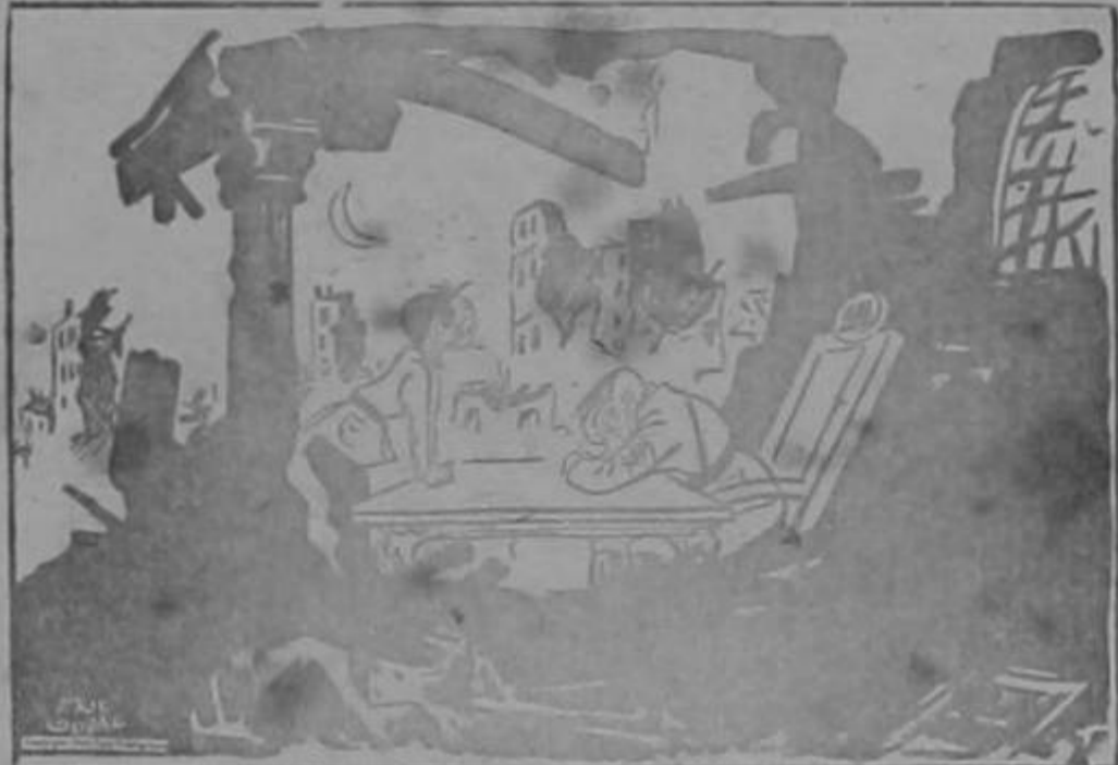
Goebbels: "Adolfo, sigue creyendo que deberíamos declarar Berlín una ciudad abierta".

En fin, que la vida no está tan cara, ¿Verdad!